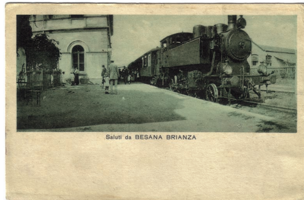
La stazione di Besana nei primi anni di esercizio con, in sosta, il treno per Molteno.